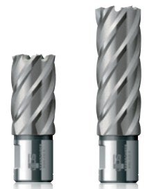
HSS-Co 8 Serija

Krunaste burgije napravljene su od specijalnog čelika sa visokim sadržajem kobalta, za povećanu otpornost na toplotu i zaštitu od habanja.